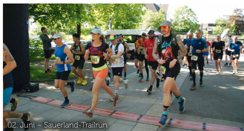
02. Juni – Sauerland-Trailrun