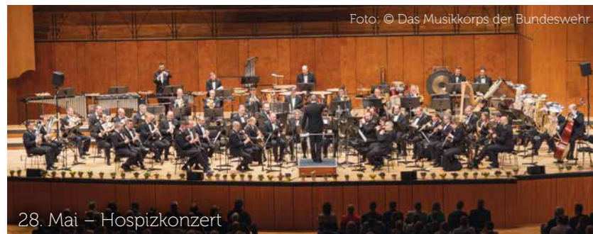
28. Mai – Hospizkonzert