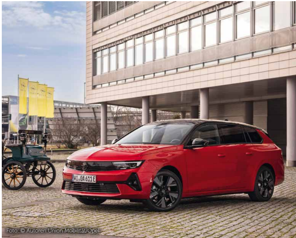
Zwischen dem Opel Patent-Motorwagen System Lutzmann und dem neuen Opel Astra Sports Tourer Electric liegen 125 Jahre. Zumindest der Sports Tourer wird auch beim Frühlingmarkt in Altenhundem zu sehen sein.

Der Frühlingmarkt in Altenhundem lockt zum Bummeln, Staunen, Shoppen und Genießen. Und auch für die Freunde der Automobiltechnik gibt es wieder einiges zu sehen. Opel feiert ein großes Jubiläum: 125 Jahre Automobilbau. In der Zeit von 1899 bis heute wurden mehr als 75 Millionen Opel-Modelle gebaut. Einige der neuesten Modelle zeigt das Autohaus Schmelter während des Lennestädter Frühlingmarktes im Bereich Rathaus/Helmut-Kumpf-Straße. Unter anderem werden der Corsa (nach dem Facelift), der Astra Sports Tourer und der pfiffige Rocks-e (den man schon mit 15 Jahren fahren darf) zu sehen sein.