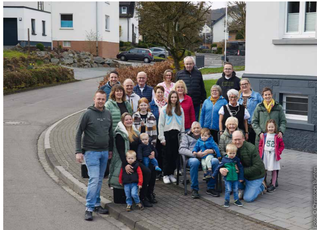
Mitglieder der Straßengemeinschaft „In der Petmecke“