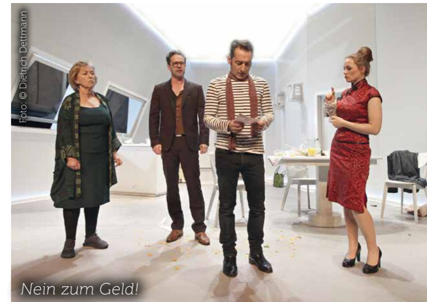
Nein zum Geld!

pointierter Lust am zivilisatorischen Zerfall das Szenario des für die Meisten unvorstellbaren Verzichts durchspielt. (...). (Tagesspiegel, P. Wildermann, 1.4.2019)